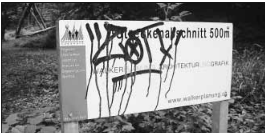
In der Begegnungszone Nordholz ist aber nicht alles nur positiv. Leider gibt es immer wieder Vandalenakte, wie mutwillige Zerstörung von Informationstafeln und Sprayereien beim Unterstand und an den Tafeln. Für Reparaturen und Instandstellung dieser Schäden wendet die Walder Sportvereinigung jährlich über 2000 Franken auf.

Start jeweils montags um 9.00 Uhr bei Jubi-Sport an der Tösstalstrasse 4. Auskünfte über Telefon 055 266 15 86.