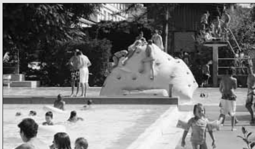
Jugendliche geniessen das Spiel auf dem Eisberg aus Kunststoff.