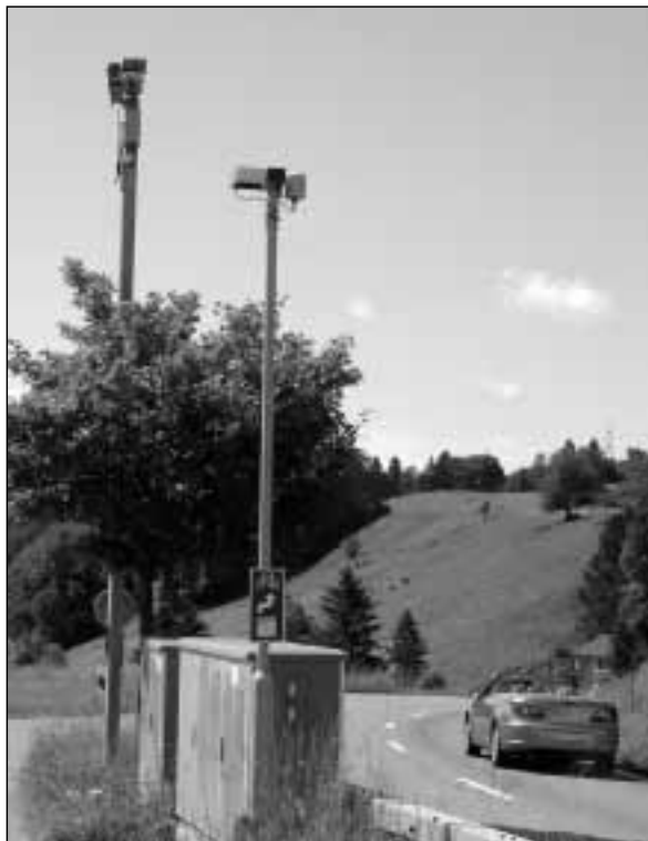
Schon jetzt bereit für den Winter: Das Glatteis-Frühwarnsystem im Ried.

heute existierenden Glatteis-Frühwarnsystems. Ursprünglich nur für Autobahnen vorgesehen, ist die Gemeinde Wald Standort von nicht weniger als vier solcher Anlagen – des hiesigen Klimas wegen. Während es in tieferen Lagen noch regnet, kann es hier schon gefrieren oder heftig schneien.