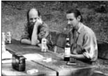
Im Nordholz hat es Platz für jedermann – für Grüppchen, die ihren Frieden suchen, für Familien mit Kindern, für Ausländer.

Der Jogger hat inzwischen sicher schon seine acht Runden auf dem weichen Holzschnitzelbelag der Finnenbahn absolviert,