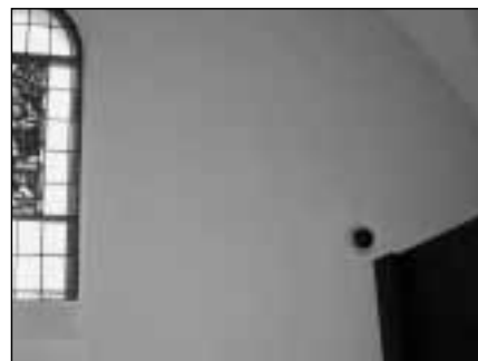
Video-Auge statt Auge Gottes? – Kamera in der katholischen Kirche Wald.