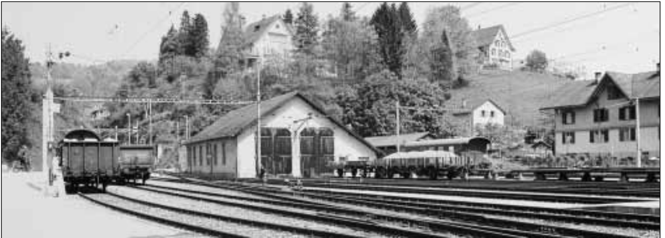
Unscheinbares Denkmal: Alte Lokremise im Bahnhof Wald.

stehende Gebäude aus seinem Dornröschenschlaf. Der Dampfbaiverein Zürcher Oberland übernimmt die Anlage von den SBB im Bau-recht und will sie künftig gemeinsam mit dem «Verein Historischer Triebwagen 5» nutzen.