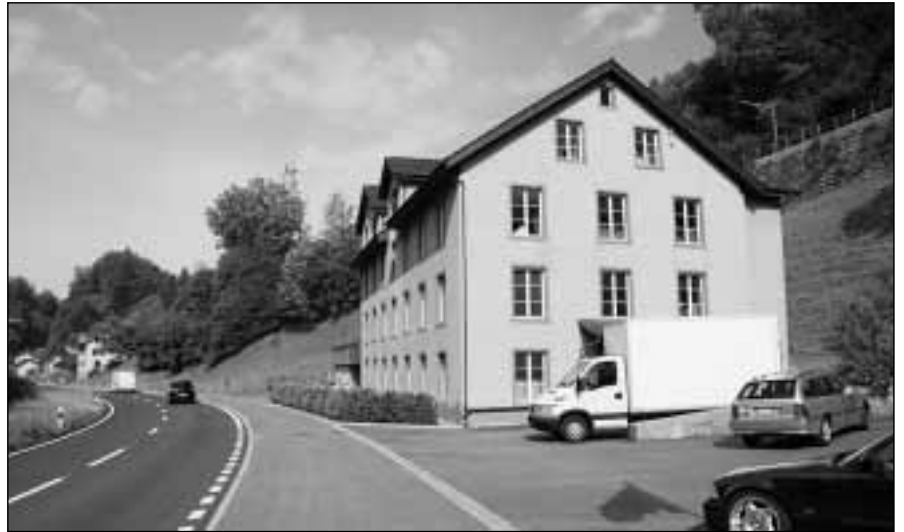
Ein Haus mit bewegter Geschichte: Einst Weberei, jetzt Werkstatt, Lager und Bastelräume.

Es sei ein geschichtsträchtiges Haus, schwärmt Vogt. Im Jahre 1870 erbaut, beherbergte es damals im Parterre und im ersten Stock eine Weberei. Die oberen Stockwerke waren unterteilt in einzelne Zimmer und kleine Wohnungen, in denen die FabrikarbeiterInnen lebten. «Das kann man sich heute gar nicht mehr vorstellen», meint Vogt nachdenklich. «In den ersten zwei