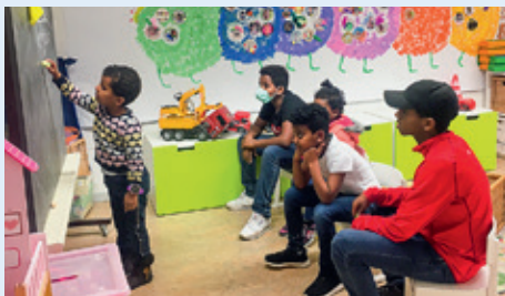
Während die Mütter lernen, beaufsichtigen die grösseren Kinder die kleinen.