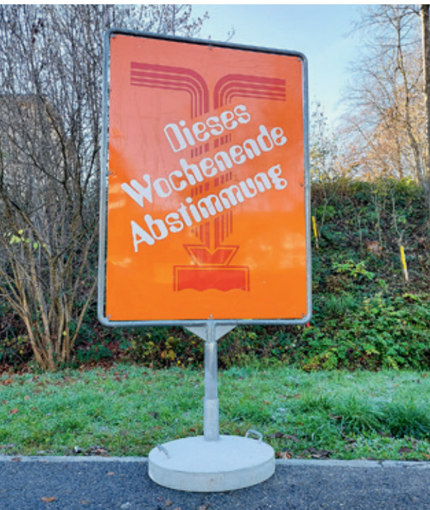
Der Stimmbürger hat's in der Hand, Wahlen und Abstimmungen sind ein wichtiger Teil unserer Demokratie.

Am Ende der Serie über die Arbeitsweise der Gremien und Fachbereiche der Gemeindeverwaltung ziehen wir ein Fazit und fragen uns: Gibt es den Amtsschimmel in der Gemeindeverwaltung? Zuvorderst soll aber der wichtigste Bestandteil einer jeden Demokratie – das oberste Organ – in den Mittelpunkt gerückt werden: die Stimmbürgerin und der Stimmbürger.