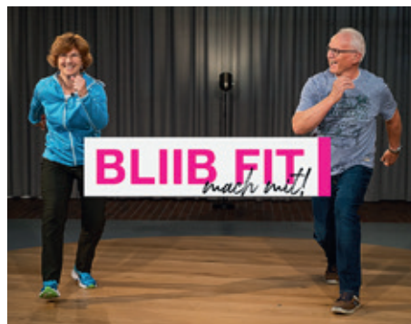
Trainings zuhause bewähren sich während der Corona-Pandemie.