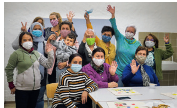
An einem der Windegg-Vormittage zu Corona-Zeiten: Das «café international» bietet beste Integration.