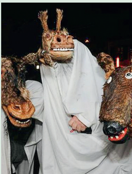
Der offizielle Silvesteranlass auf dem Schwertplatz fällt Corona zum Opfer. Schnappesel und Silvesterchlaus sind trotzdem in der Gemeinde unterwegs.

Gemeinde Wald ZH, Abteilung Raumentwicklung und Bau, Christian Zwahlen, 055 256 51 80, christian.zwahlen@wald-zh.ch