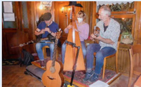
Zur Eröffnung des Zürcherhofs spielte die Band irische Standards.

Der Zürcherhof öffnete nach fünfjähriger Pause seine Türen. Der Samstagabend war ganz Samhain gewidmet, dem keltischen Fest am Tag vor Allerheiligen, heute amerikanisch als Halloween gefeiert. Nebst irischer Musik, gespielt von einer