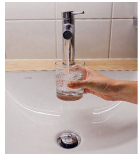
Gemäss der Studie kann das Walder Trinkwasser ohne Bedenken konsumiert werden.

Die Verwendung von Chlorothalonil, ein über Jahre in der Schweiz genutztes Pflanzenschutzmittel, ist seit Anfang 2020 verboten. Abbauprodukte des als potenziell gesundheitsgefährdend geltenden Mittels können teils im Grundwasser nachgewiesen werden und überschreiten vielerorts die geltenden Höchstwerte für Trinkwasser. Der Kanton Zürich hat dazu im September einen Bericht des kantonalen Labors veröffentlicht – mit positiven Feststellungen zu Wald: In keiner der in unserer Gemeinde entnommenen Proben konnte Chlorothalonil nachgewiesen werden. In Wald stammt das Trinkwasser aus Quellwasser – in Trockenperioden selten aus aufbereitetem Seewasser – das nicht mit Chlorothalonil belastet ist. (mk)