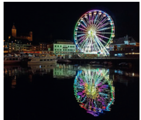
Das Riesenrad als Symbol des Lebens.

praxis für naturheilkunde chrischta ganz