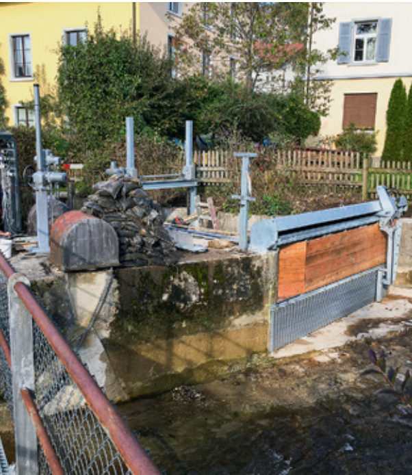
Der neu installierte, hier trocken liegende Rechen (unten) mit dem Schwemmgut-Abstreifer.

Fische sollen nicht in der Turbine enden! – An der Abzweigung des Bleiekanals von der Jona, nahe der Markthalle, entstand eine neue Rechenanlage.