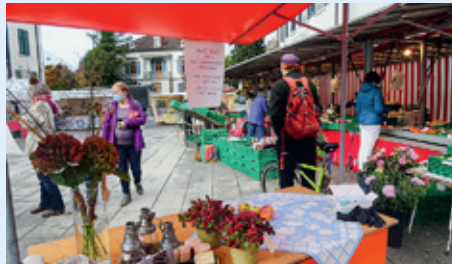
Ein buntes und vielseitiges Angebot am Wochenmarkt.

Ein letztes Mal die Markt-Atmosphäre einatmen, sich am gluschtig gesunden Angebot von Frischem jeder Couleur bedienen, Begegnungen mit einem Schwatz verbinden. – Der Saisonabschluss des Wochenmarktes lockte nochmals etliche Kundinnen und Kunden auf den Schwertplatz. Obwohl die Käuferschaft situationsbedingt