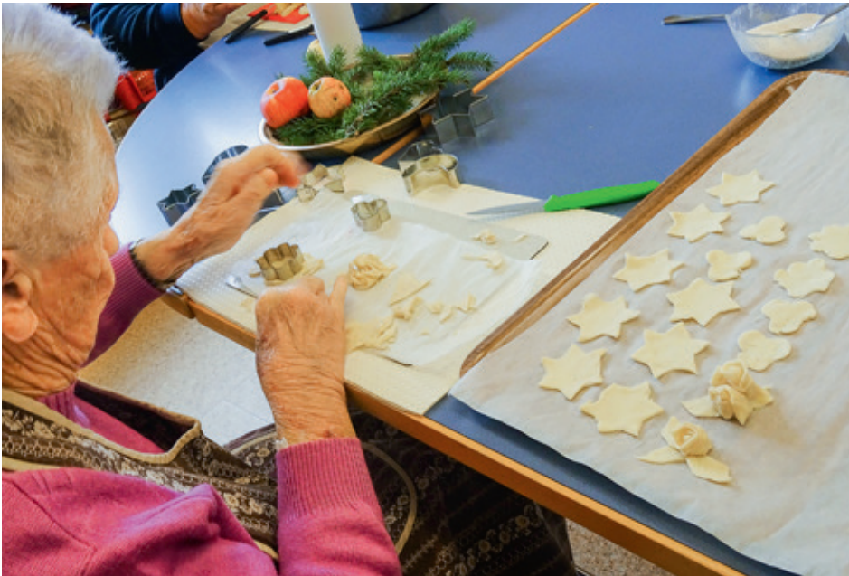
Weihnachtsstimmung auch in der Backstube: Eine Bewohnerin sticht Mailänderli aus.

Weihnachten steht vor der Tür. Inwieweit sie hereingebeten werden kann, bestimmt einmal mehr das Coronavirus. Gleichwohl ist die Planung für das Christfest im Altersheim «Drei Tannen» in eifriger Bewegung. Situationsbedingt sind Flexibilität und kreative Ideen gefragt. Die Vorfreude auf eine lichtvolle Feier ist ungeachtet der Umstände im ganzen Haus spürbar.