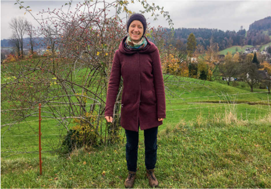
Im Spätherbst ist die Hagebutte reif, bereit, gepfückt und getrocknet zu werden für einen vitaminreichen Tee im Winter.

■ «Wenn ich nach der Arbeit mit dem Velo den «Schtutz» des überbauten Sunnematte-Quartiers erklommen habe, tauche ich ein ins Grüne mit seiner wunderbaren Weite, die bis zu den Bergen reicht. An Weiden und Tieren vorbeiradelnd, empfinde ich Glücksmomente: Es ist Feierabend und ich fahre heim durch die Natur, da wo es mir am wohlsten ist. Ich kenne die Pflanzen hier. Es ist erstaunlich, dass jetzt, im November, noch Wiesenlabkraut blüht. Den wohlriechenden Thymian mit den violetten Blüten begrüsse ich im Vorbeifahren. Pflanzen sind für mich auch Lebewesen und ich bringe ihnen Respekt und Achtsamkeit entgegen. Ich geniesse meinen Arbeitsweg zu jeder Tages- und Jahreszeit. Am Morgen läuft mir manchmal ein Fuchs über den Weg und in der Dunkelheit staune ich über den wunderbaren Sternenhimmel.