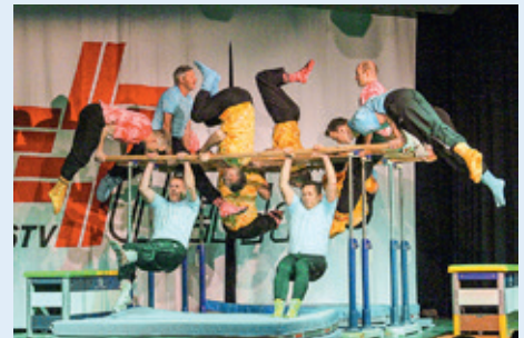
Kraft- und schwungvoll turnte sich die «Aktivriege plus» durch ihr Barrenprogramm.

«So chas nöd wiiterga» – in der Multimedia-Show unter diesem Titel stiegen Helvetia und Wilhelm Tell vom Himmel auf die Erde, um einen neuen Nationalhelden zu finden. Sie besuchten unter anderem Christa Rigozzi, Ueli Maurer, Roger Federer oder Musikstars wie Gölä oder DJ Bobo, ohne fündig zu werden. Klar, dass sich die verschiedenen Riegen am Turnerchränzli zwischen diesen einzelnen Besuchen mit rhythmischen, tänzerischen, turnerischen oder akrobatischen Darbietungen profilieren durften. Dreimal ein voller Schwertsaal war der Lohn für eine gelungene, witzige und abwechslungsreiche Show des Turnvereins. (wb)