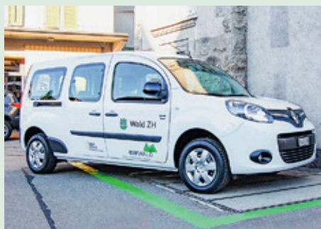
Das Walder Carsharing-Elektrofahrzeug ist auf dem Schlipfplatz parkiert.

Die Nutzungstarife sind jetzt noch übersichtlicher und attraktiver gestaltet. Neu bezahlt man einen Fixbetrag pro Stunde ohne Kilometerbeschränkung, der mit der Mietdauer immer günstiger wird. Der fünfplätzig Renault Kangoo mit einer Reichweite von über 180 Kilometern und einem Ladevolumen von bis zu 3400 Litern steht auf dem Schlipfplatz zur Ausleihe bereit.